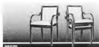
Denver rakásolható szék.jpg 27K Megtekintés Ellenőrzés és letöltés